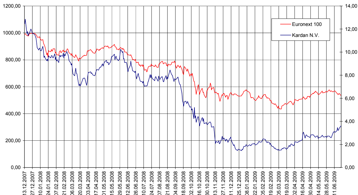
Рис. 2 Динамика курса акций Kardan N.V. и фондового индекса Euronext 100 с 25.06.2007 по 22.06.2009

4. Kardan N.V. обладает достаточными финансовыми ресурсами для противостояния кризису. Основная активность группы в сегменте недвижимости велась в Польше и Венгрии, т.е. на рынках, которые менее всего в Центральной и Восточной Европе (ЦВЕ) пострадали от кризиса. Также обращает внимание тот факт, что группа работает в сегменте недвижимости в Китае, 2008 год для группы на этом рынке можно считать достаточно успешным. По информации самой группы на начало 2009 года из 8800 завершенных объектов и объектов на стадии строительства КНР объектов было уже продано 5500. В общей сложности группа сконцентрировала свой строительный бизнес в 6 городах Китая. Позитивные тенденции дает и анализ основных показателей деятельности Kardan N.V. за последний год (табл. 6).